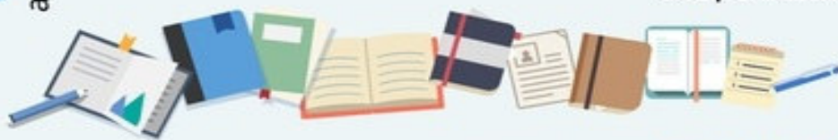
График проведения апробационных ВПР в 2020 году